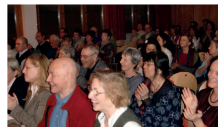
Beste Stimmung in der VHS Floridsdorf bei „WIR – Brückenschlag der Kulturen“