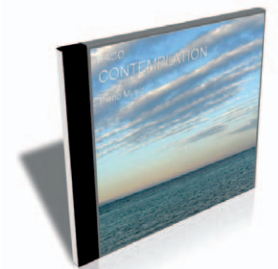
Contemplation – Piano und Poesie für Feinschmecker